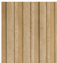
GOLDEN OAK - MCB320G