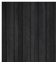
BURNT CEDAR - MCB320R