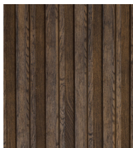
ANTIQUÉ OAK - MCB320A