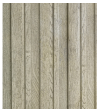
SMOKED OAK - MCB320D